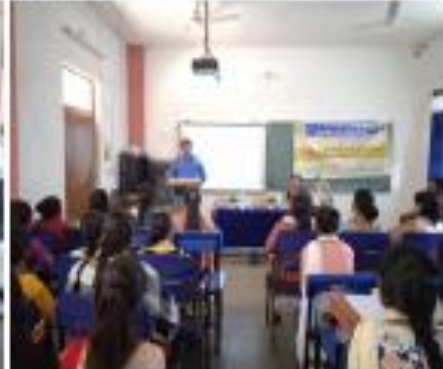
Parasara, Orissalagan, India 0268+802, Parasara, Orissalagan 751021, India Lat: 21.45142° Long: 85.68601° 12/12/2022 12:57:48 PM