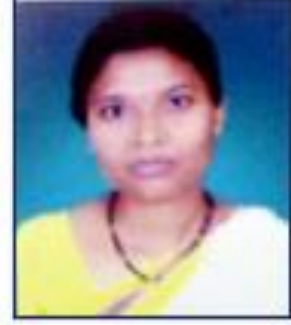
श्रीमती माथुरी पिकी प्रमोदशाळा हस्तनीशिक्षक